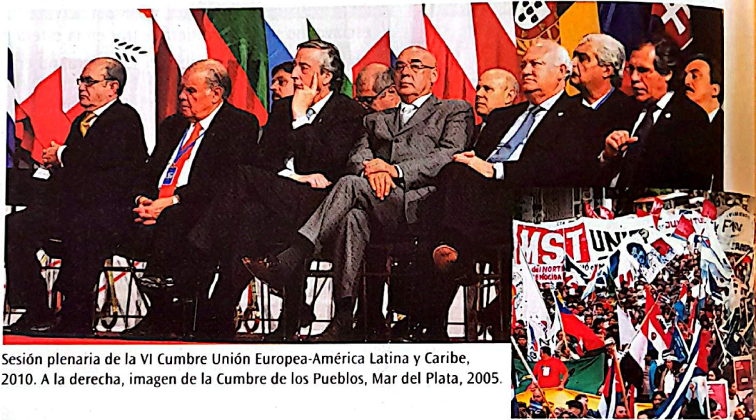
Sesión plenaria de la VI Cumbre Unión Europea-América Latina y Caribe, 2010. A la derecha, imagen de la Cumbre de los Pueblos, Mar del Plata, 2005.

Pensaremos a la política en dos sentidos: como ámbito de lo público y del interés general, atravesado por conflictos y por relaciones de poder, y también como lugar en el que es posible expresar las inquietudes y participar para construir una sociedad mejor.