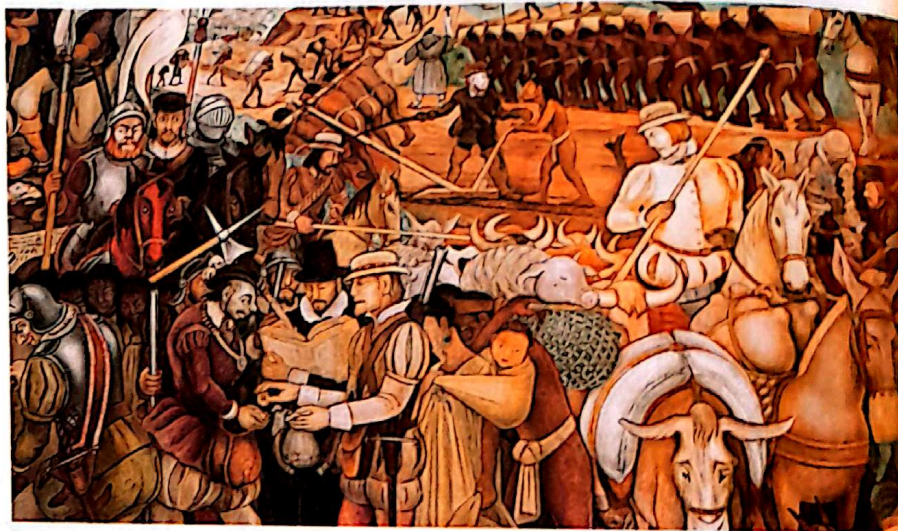
Desembarco de los españoles en Veracruz, mural de Diego Rivera.

La palabra 'poder' y otras que derivan de ella se utilizan con distintos significados. Por ejemplo, cuando decimos 'puede que la manifestación sea multitudinaria', nos referimos a la posibilidad de que algo suceda. En cambio, 'la ciudadanía pudo votar libremente' se refiere a la capacidad de actuar de una persona o grupo, y 'el Congreso tiene en su poder la decisión', al dominio sobre algo. Este capítulo tratará sobre el poder social y político, es decir, formas de relación entre personas y grupos.